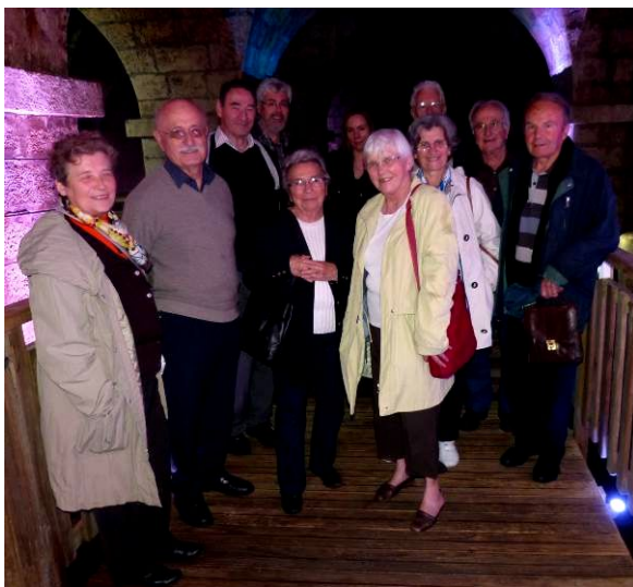
CA du CEPB à Salies-de-Béarn, juin 2012

Plus qu'un simple administrateur engagé au Centre d'étude du protestantisme béarnais et au musée Jeanne d'Albret, c'est un ami qui vient de nous quitter. Membre fondateur des deux associations, il a beaucoup contribué à leur développement. Fidèle administrateur depuis leur origine, il leur a apporté son énergie, son dynamisme, sa joie communicative et son enthousiasme.