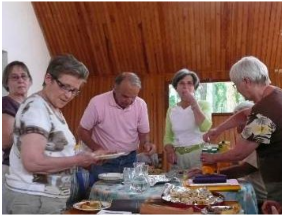
CA du CEPB à Hossegor, juin 2009